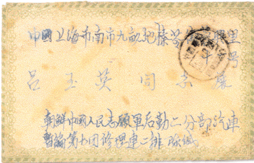
▲ Le courrier d'un soldat chinois : l'oblitération porte la date du 17 mars 1952. Elle est expédiée à Shanghai par un volontaire du 7 e régiment motorisé de l'armée populaire de Chine. Au dos, le cachet d'arrivée porte la date du 5 avril 1952.

Quelques plis envoyés par des militaires américains faits prisonniers par les armées du Nord – parfois ce furent des pilotes dont l'avion avait été abattu – ont refait surface ces dernières années. Écrits pendant leur captivité, ces plis indiquent tous clairement de quel « camp de prisonniers » ils furent envoyés. Les plus anciens ont la mention « Chinese People's Committee for World Peace » écrite à la main au recto de l'enveloppe, « à la demande » des gardiens chinois. Chaque lettre était bien entendu censurée par les Chinois. Ces lettres sont le plus souvent adressées aux épouses des soldats prisonniers ou à leur famille. Après la signature de l'armistice en 1953, ces prisonniers ont pu regagner les États-Unis ou leur pays d'origine. Mais, et cela est plus difficile à imaginer, quelque 20 Américains faits prisonniers par les « Nordistes », à la fin de la guerre, ont décidé de rester en Corée du Nord pour s'y établir définitivement. Leurs lettres permettaient, malgré la censure nord-coréenne, de se faire une petite idée des conditions difficiles dans lesquelles ils vivaient leur nouvelle vie de communiste. Inutile de dire que de tels plis constituent une vraie rareté !