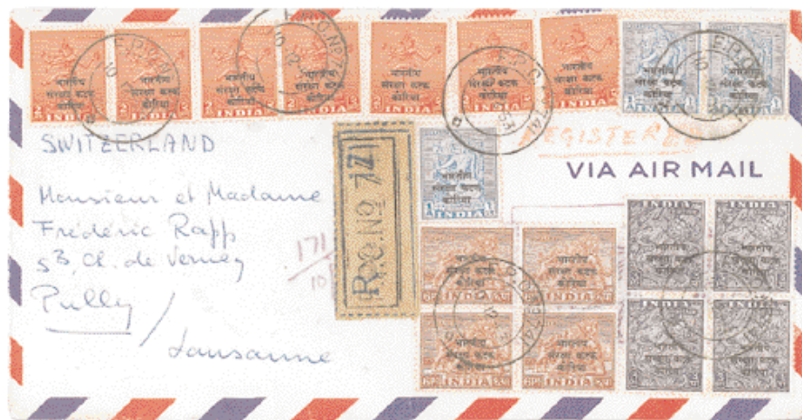
▲ Pli d'un observateur suisse de la NNRC posté au bureau de la poste militaire indienne FPO 741, dédié à la NNRC. Les timbres utilisés sont les timbres indiens surchargés en noir avec la mention « Force d'interposition indienne en Corée ».

Voici ce qu'en écrit un lieutenant suisse qui était sur place en 1953-1954 en tant qu'observateur de la NNRC : « Ces timbres indiens surchargés étaient à l'usage exclusif de la troupe qui avait la garde des 34 000 prisonniers nord-coréens et chinois en mains des troupes de l'ONU et des 16 prisonniers américains en mains des Nord-Coréens. Tous ces prisonniers avaient été transférés en zone neutre près de Panmunjon et gardés par une troupe neutre en vue de leur rapatriement. Celui-ci ayant duré trois mois environ et la force indienne étant de 3 000 hommes, il ne doit pas y avoir beaucoup de ces timbres en circulation » (signé Ed. Logoz).